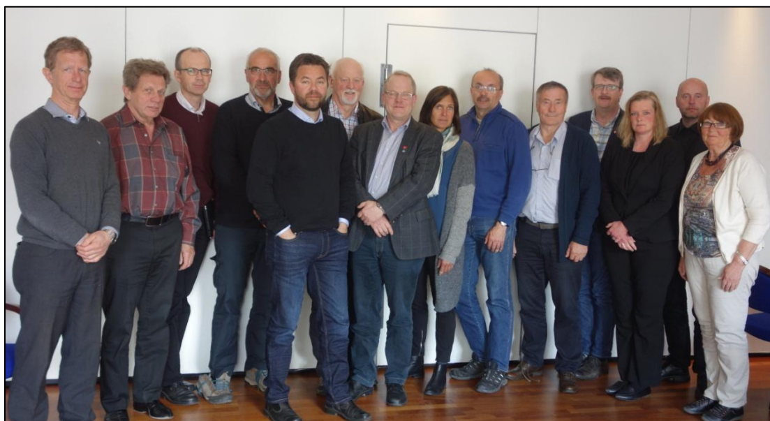
Hardangerviddarådet 13. mai 2015